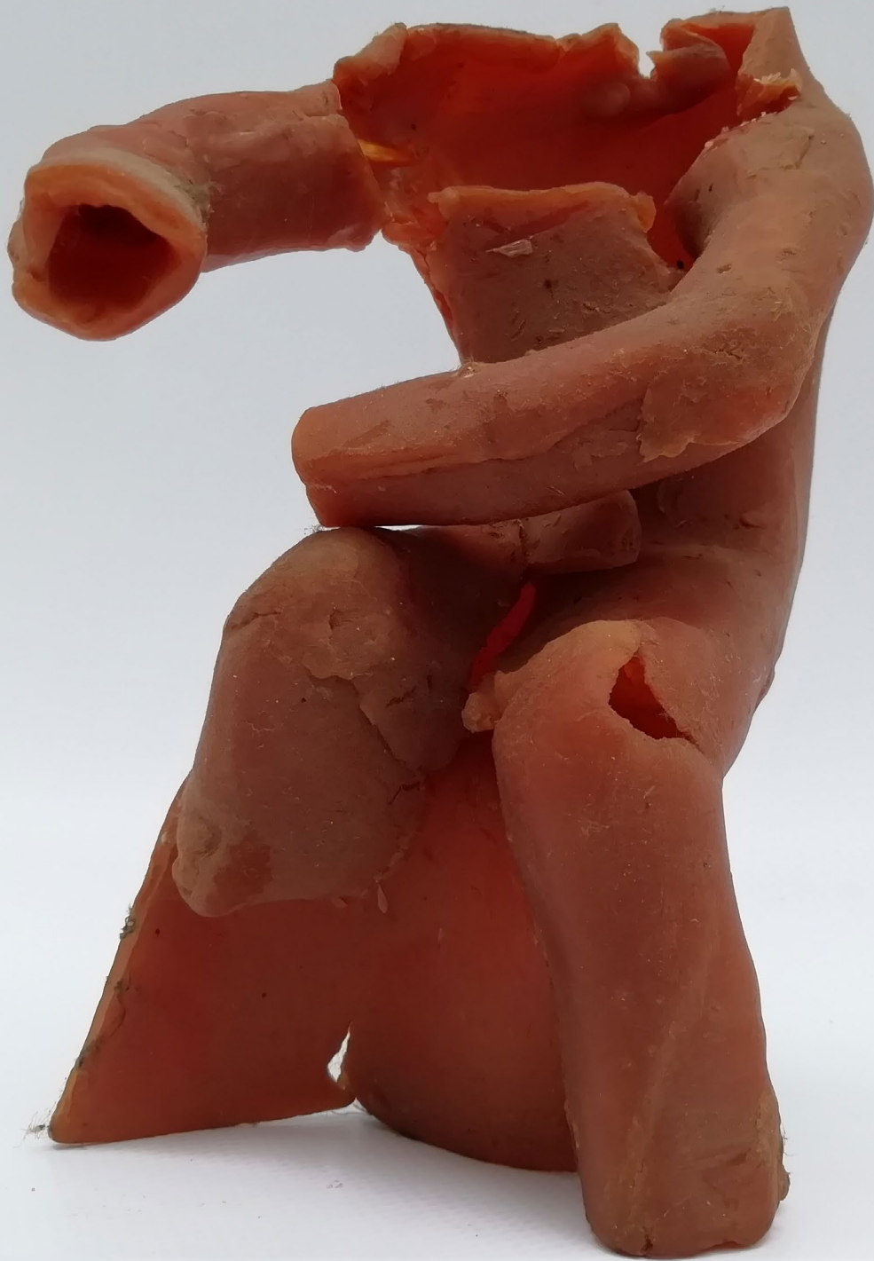
Maquette in was